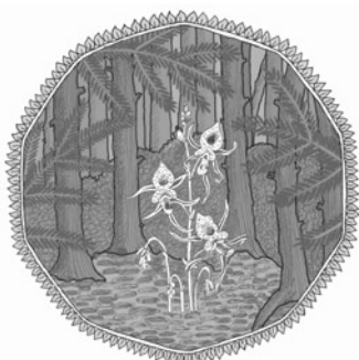
De epipogon van Eli Heimans De spreeuwen van Jac. P. Thijsse