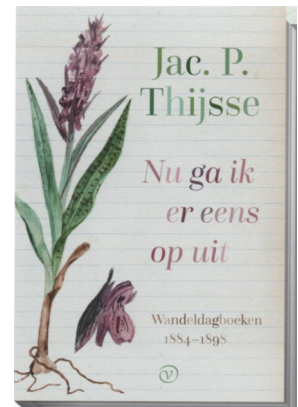
Dagboeken van Jac. P. Thijssse: verwacht voorjaar 2021. Verkrijgbaar in de boekhandel.